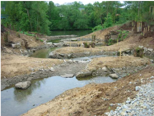
Umgehungsgerinne Bamberg ERBA