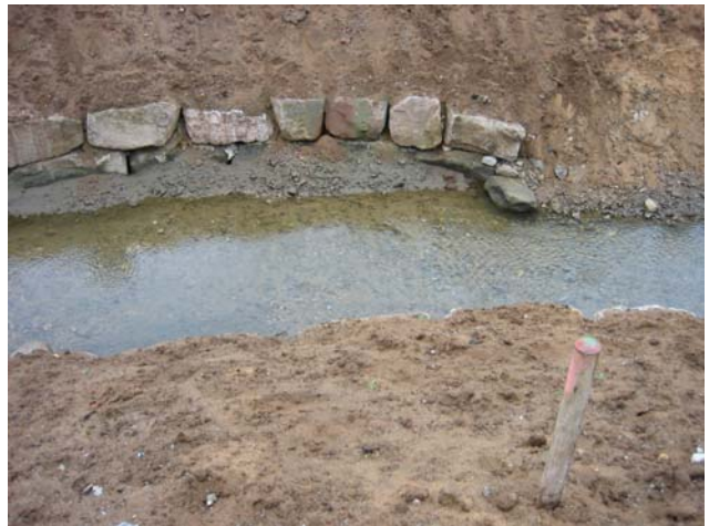
Umgehungsgerinne Bamberg ERBA