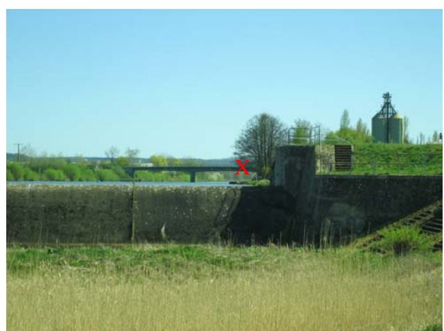
(linksseitig): hier geplante Schraubenturbine x