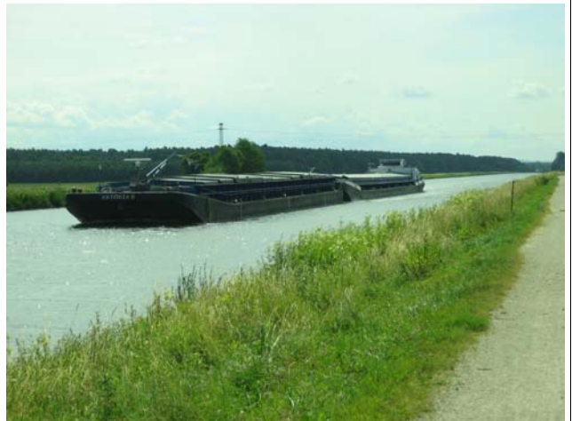
Stauhaltung Bamberg-Strullendorf (~7km)