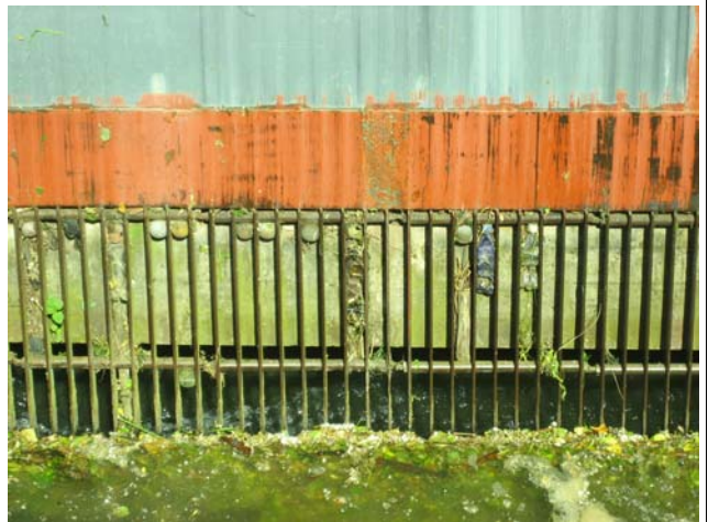
Rechen KW Bamberg-Gaustadt (ERBA)