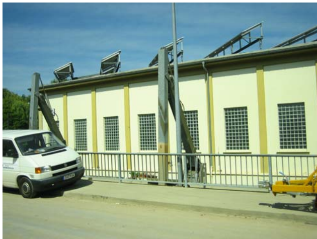
Turbinenhaus KW Bamberg-Gaustadt (ERBA)