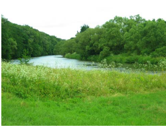
Die Regnitz oberhalb Bamberg-Bug