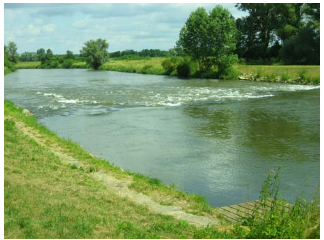
Die Regnitz unterhalb Pettstadt (Fähre)