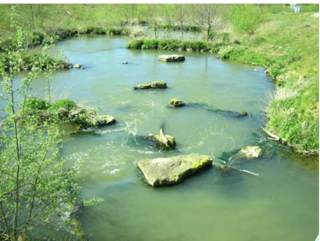
Umgehungsgerinne Neuses a. d. Regnitz