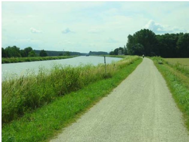
Main-Donau-Kanal bei Bamberg-Bughof