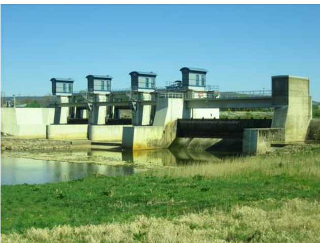
Wehr Neuses a. d. Regnitz (rechtsseitig)